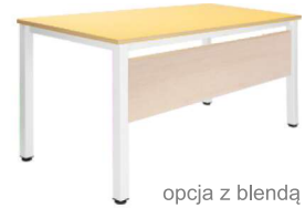
opcja z blendą