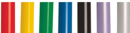
standardowe kolory stelaży metalowych