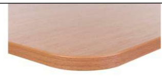
opcja – zaoblone narożniki blatu, okleinowane PCV 2 mm – za dopłatą