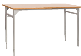
● stół zak z regulacją 2 osobowy