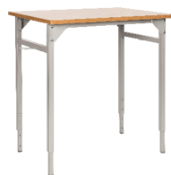
● stół zak z regulacją 1 osobowy

Wymiary zgodne z zasadami doboru stanowiska pracy ucznia i normy PN-EN 1729-1:2016; PN-EN 1729-2+A1:2016